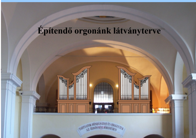
Építendő orgonánk látványterve